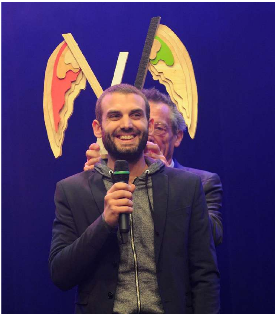
Stan, Lauréat du Dinard Comedy Festival - prix remis par Patrice Leconte - Photo: Dinard Festival