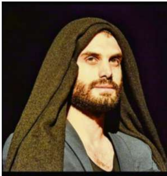
De la Joconde (notre photo) à la Vénus de Milo, de "l'homme enceint" au rappeur avéré, il met l'humour de manière subtile au service de la poésie.