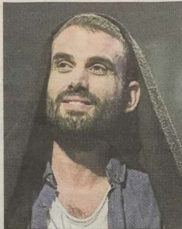
Stan, un volcan de culture au Complexe.

Son spectacle Quelque chose en nous de Vinci est complètement foutraque. On y rencontre des enfants pénibles persuadés d'être de futures stars, un employé des Galeries Lafayette atteint du "syndrome Mickaël Jackson" (entendez